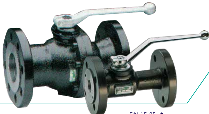
DN 65-100 ▲